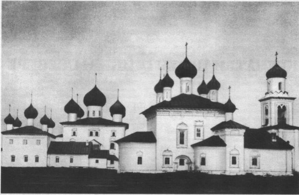
Старая торговая площадь. Фотография XIX века

М.К.) было закончено в 1778 году, о чем свидетельствуют документы других дел областного архива: "При соборной и Предтеченской церквях каменная колокольня о двух этажах построена в 1778 году казенным коштом" 8 , то есть за казенный счет; "каменная соборная колокольня, двухэтажная, построена по именному ее императорского величества повелению; в ней колокола с часами; построена в 1778 году и находится в ведомстве церковей собора и Предтечи" 9 .