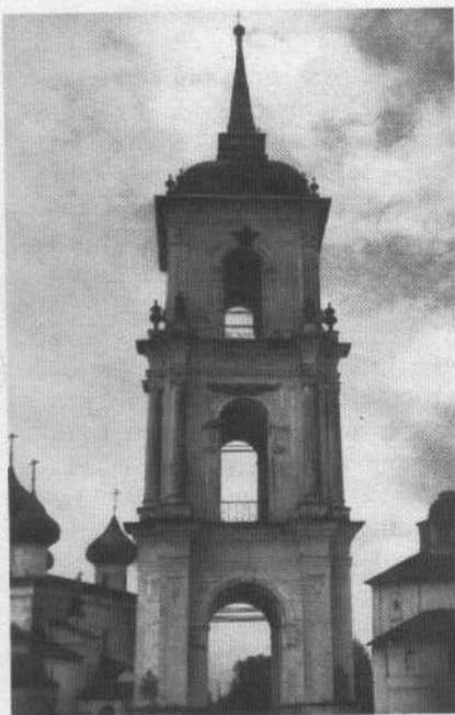
Колокольня на Новой торговой площади в ансамбле с Христорождественским собором и церковью Введения

Подрядчики обязались построить колокольню за три года. Но из документа, датиро-