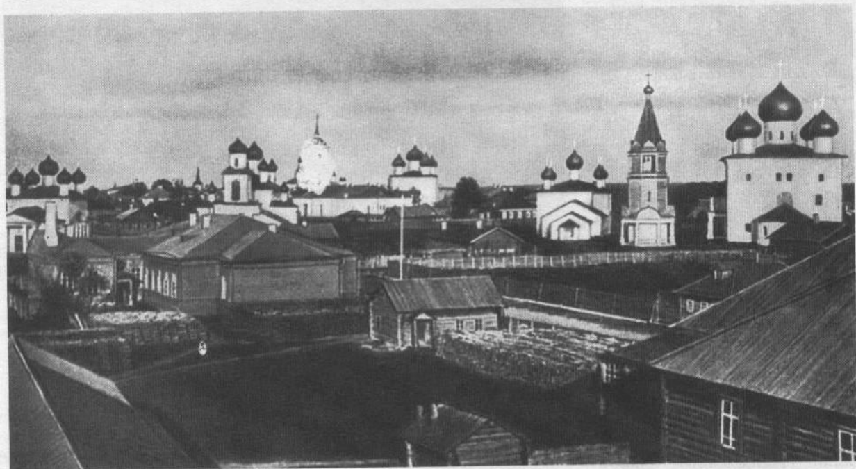
Вид на Старую торговую площадь с Вытегорской дороги. Фотография XIX века

Строительство колокольни «против данного плана и сделанной модели» 7 (деревянный макет колокольни сейчас находится в исторической экспозиции музея-заповедника. —