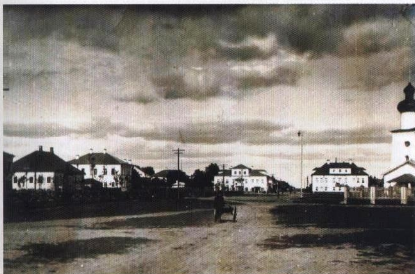
Рис. 2. г. Каргополь. Вид на Соборную площадь. 1910-е гг. КИАХМ. КП 12037/9

Далее остановимся на застройке отдельных городских кварталов. Следует обратить внимание, что Каргополь стал одним из первых российских городов, перестроенных по регулярному плану. Этот план максимально учитывал исторический образ прежнего города. В нем сохранялись основные узловые средневековые точки, удачно вписанные в новый облик. В этом отношении замечательна Соборная площадь с рядовой застройкой, обрамляющей ее. Планом предусматривалась отодвинутая вглубь квартала линия домов, открытая панорама площади. Храмовый ансамбль и окружающая его застройка воспринимались единым комплексом (рис. 2).