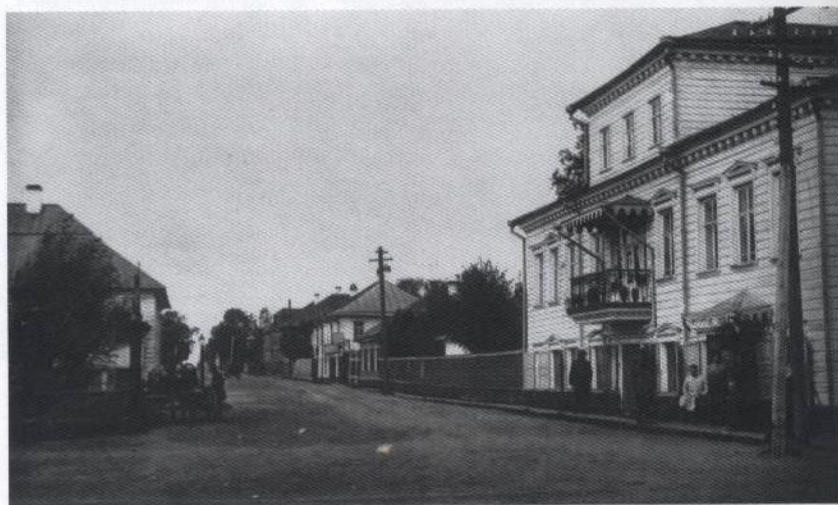
Рис. 4. г. Каргополь. Дома по ул. Ивановской, разобранные при создании новой площади. Нач. XX в. КИАХМ. КП 12037/11.

Оба здания по периметру главной площади двухэтажные деревянные, выстроенные в соответствии с предписаниями к застройке. Дом со стороны ул. Ивановской (ныне ул. Победы) занимал важное положение в планировочной структуре площади,