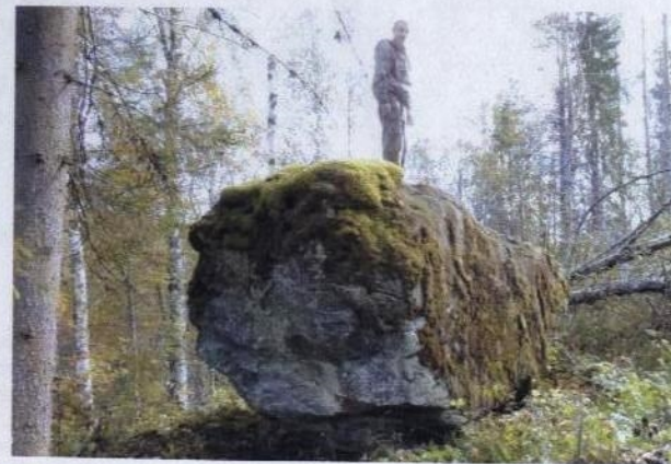
Рис. 3. Конь-камень на р. Чурьеге близ д. Щелье