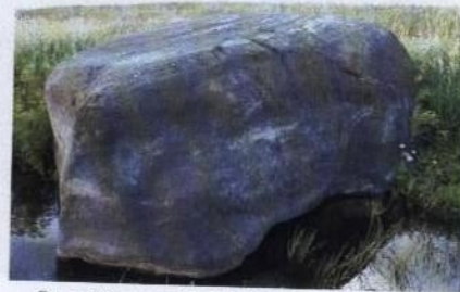
Рис. 1. Камень со «следами от канатов» близ д. Ореховской