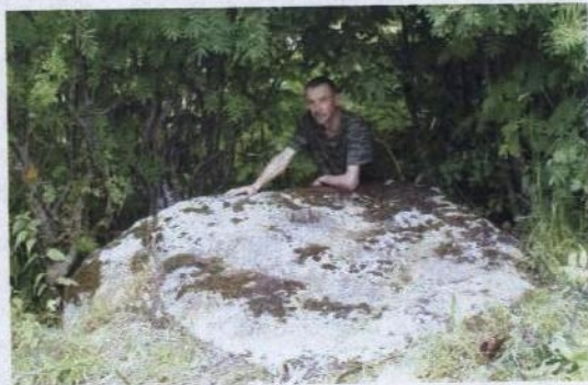
Рис. 2. Камень Пёсья Лапа в Тихманьге

В Тихманьге с давних пор передают легенду об императрице Екатерине Великой, якобы проезжавшей тут по пути в Каргополь. По преданию, здесь на карету напали разбойники, похитили ее сокровища и спрятали их под большой камень, называемый Пёсьей Лапой, так как есть на нем большое углубление в виде собачьего следа. Говорят, разбойников поймали, но клад так и не нашли и он до сих пор там лежит 5 :