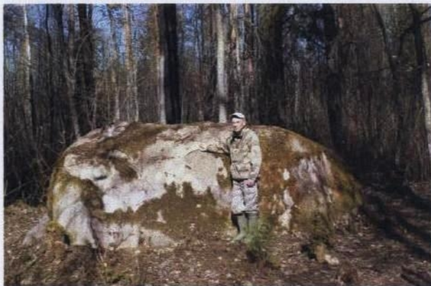
Рис. 5. Конь-камень близ д. Палашалга

В апреле 2019 года, после двух лет безуспешных поисков, удалось, наконец, отыскать еще один Конь-камень, расположенный около бывшей д. Палашалга Ошевенской волости, примерно в 100 м от Ошевенского тракта. Раньше он находился посреди пашни, опаживался вокруг и был хорошо виден с дороги. После Великой отечественной войны поле начало зарастать мелколесьем, здесь пасли