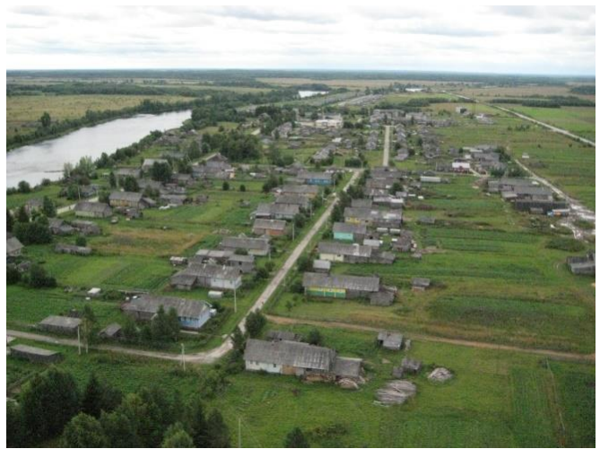
Илл. 2. Вид на деревни Подрезовскую и Семеново, на р. Онегу и Архангельский тракт (Усачево). Фото 2008 г.