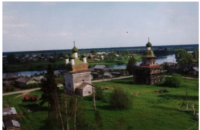
Илл. 3. Церковь Михаила Архангела (слева) и Сретенская церковь. Фото А. Сорина, 2000 г. Каргопольский музей, научный архив.