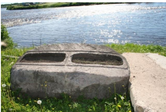
Илл. 5. Остатки водяной мельницы на берегу р. Онеги около д. Ильино (Надпорожье). Фото 2006 г.