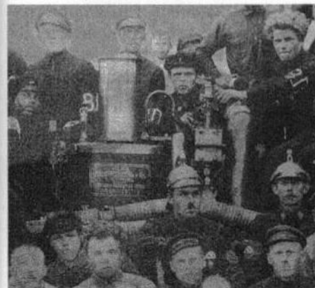
Рис. 2. Члены пожарной команды г. Каргополя вокруг паровой пожарной машины акционерного общества «Лангензипень и К°» в 1920-е годы. Фрагмент фотографии. КГИАХМ КП № 19152 ФТ-3043

К 1914 году была куплена паровая пожарная машина акционерного общества «Лангензипень и К°» (рис. 2) [6, С. 42–43], которая передвигалась на конной тяге, как и машины завода «Густав Лист», но для прокачки воды уже не требовала ручного труда.