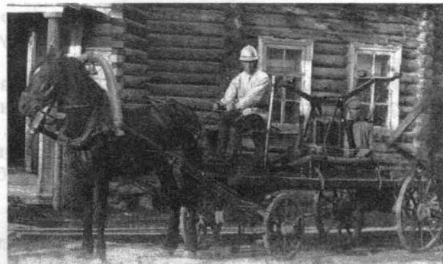
Рис. 1. Каргопольский конный пожарный ход с ручным насосом завода «Густав Лист» в 1920-е годы. Фрагмент фотографии. КГИАХМ КП № 19153 ФТ-3044

[20, С. 3]. Таким образом, при пожарных случаях город мог располагать новыми пожарными машинами, не говоря уже о старых имеющихся при пожарном обозе, из коих две довольно порядочные и могут действовать хорошо.