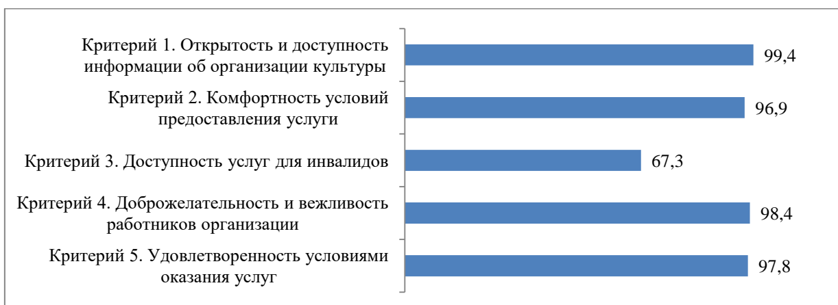
Рисунок 35. Итоговые значения показателей независимой оценки качества условий оказания услуг в организации «Каргопольский историко-архитектурный и художественный музей», баллы

Итоговые значения показателей, характеризующих общие критерии оценки качества условий оказания услуг организации «Каргопольский историко-архитектурный и художественный музей», представлены на рисунке 35 и в Приложении 2.