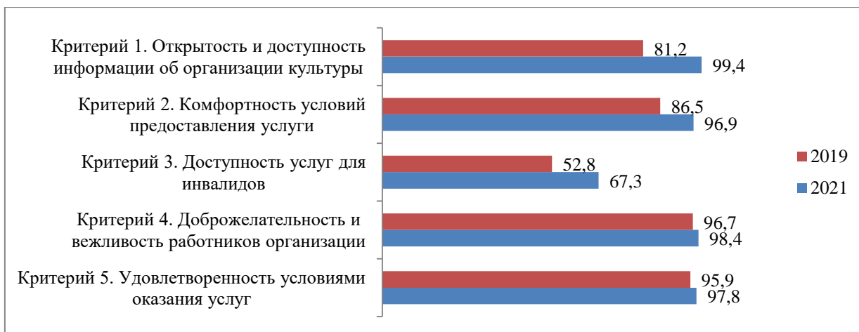
Рисунок 36. Показатели независимой оценки качества условий оказания услуг в организации «Каргопольский историко-архитектурный и художественный музей» в 2019 и 2021 гг., баллы

В целом за прошедшие три года оценка качества условий оказания услуг потребителями значительно не изменилась и осталась на высоком уровне (рисунок 36). За прошедший период повысилась оценка доступности услуг для инвалидов, а также открытости доступности информации об организации в открытых источниках и комфортности условий предоставлений услуг в организации культуры.