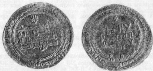
Рис. 1 Дирхем из Подпорожья

Особый интерес представляет серебряная монета – дирхем (Саманиды, Наср б. Ахмад, аш-Шаш, 303 г.х. – 915/916 г.) 10 . Она найдена на левом берегу р. Онеги, в излучине реки между деревнями Надпорожский Погост и Ильинское (в 6 км к северу от Каргополя). Это третья находка арабской монеты на Кагополье (рис.1).